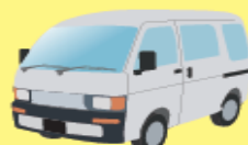
事業用車両（黒・緑ナンバー）