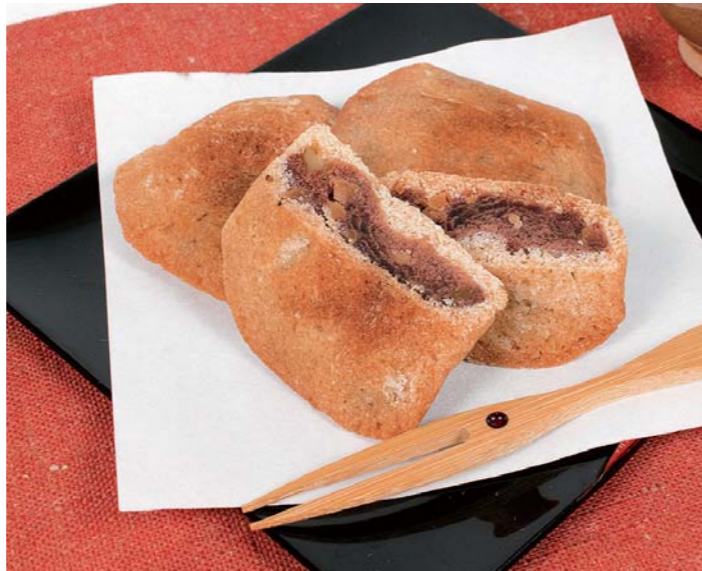
写真15個入り (税込1,500円) 商品番号 S-10 10個入り 税込1,000円 商品番号 S-11 15個入り 税込1,500円

邑南町矢上に古くから伝わる 民話「やまんばん伝説」を基 に、試行錯誤し生まれた洋菓 和菓子です。バターケーキ生 地でくるみ餡を優しく包みま した。過去には第21回全国菓 子博覧会にて金賞を受賞、テ レビ朝日系列のドラマにも登 場した自慢の逸品です。地域 のストーリーを感じられ会話 に花が咲く、手土産にぴった りのお菓子です。