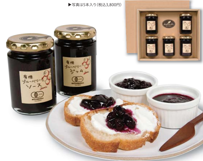
▶写真(は5本入り(税込3,800円))

森脳ブルーベリーファーム 〒696-0223 島根県邑智郡邑南町下亀谷696-1 TEL:0855-83-1600 FAX:0855-83-0770