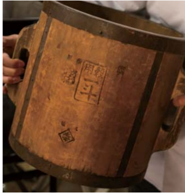
道具も祖父の代から受け継いでいるものばかり。撮影した小麦から風力で極微を取り除く唐箕(とうみ)・写真の一斗升など、資料館に飾られていてもおかしくない貴重な道具が現役で使われている。