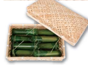
写真8個入り(税込3,650円) 商品番号 S-03 5個入り 税込2,500円 商品番号 S-04 8個入り 税込3,650円

保存料や防腐剤を一切使用せ ず、丁寧に作った水羊かん を、自然の竹に流し入れまし た。竹の底に穴をあけ息を吹 き込むと、つるんと出てきま す。その気持ちよさとフクワ ク感に、子どもから大人まで 思わず笑顔になってしまうは ず。くちどけ滑らかですっき りとした甘さ、みずみずしい 青竹の香りが夏の爽やかさを 感じさせる一品です。