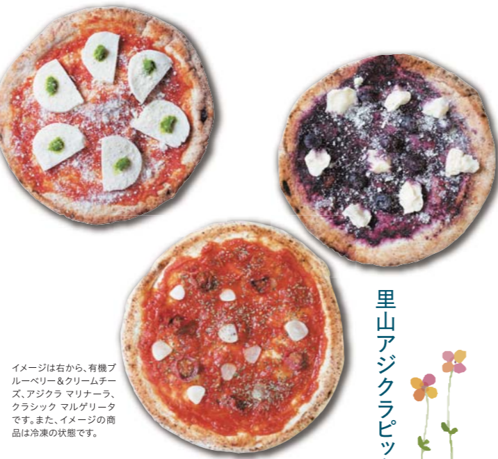
イメージは右から、有機ブルーベリー&クリームチーズ、アジクラ マリナーラ、クラシック マルゲリータです。また、イメージの商品は冷凍の状態です。

(株)トリコン 〒696-0102 島根県邑智郡邑南町中野3825番地8 TEL:0855-95-2150 FAX:0855-95-0120