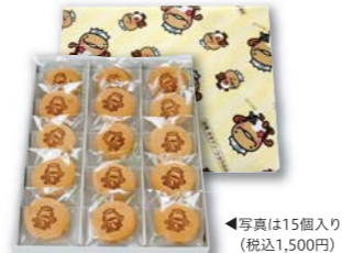
写真15個入り (税込1,500円) 商品番号 S-12 10個入り 税込1,000円 商品番号 S-13 15個入り 税込1,500円

2019年にはBSS山陰放 送でも紹介された、子どももか ら大人まで幅広く人気のミニ ブッセ。邑南町産のキビ粉と 米粉を使った生地に、同じく 邑南町産ブルーベリーがアク セントになったチョコレート クリームをサンドしていま す。邑南町で愛され続けてい るゆるキャラ「オオナン・ シヨウ」のかわいい焼印が目 を引く一品です。