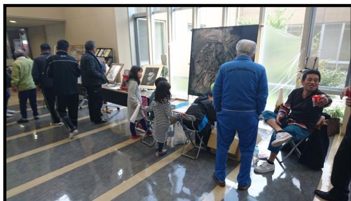
(グッズ販売コーナー)